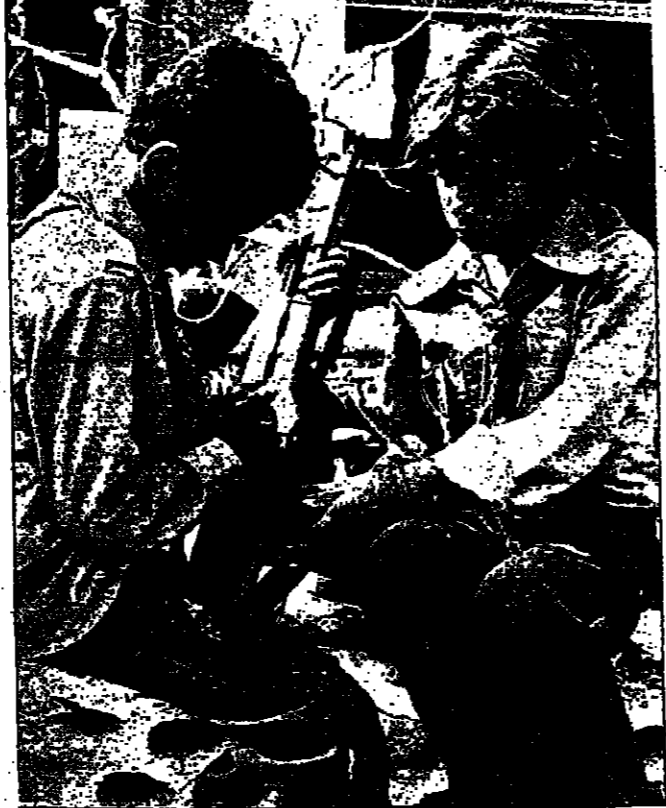
السلح لعبة اطفال لبنان المفضلة

يصنع في مكان اخر ، وان مهمة الكلاسيكوف هنا هي لتقيد ذلك القرار ، ولا يلس ان يقل ثلثا فلانا ما دام لكل شيء ثمن .